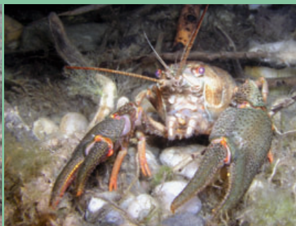
■ Rak bahenný