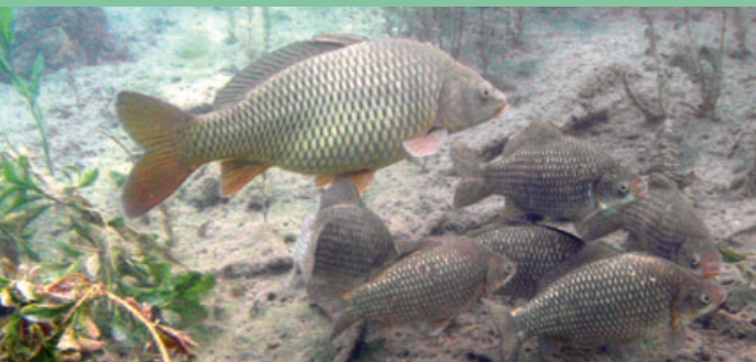
■ Kapor postokaspický, Karasy obyčajné